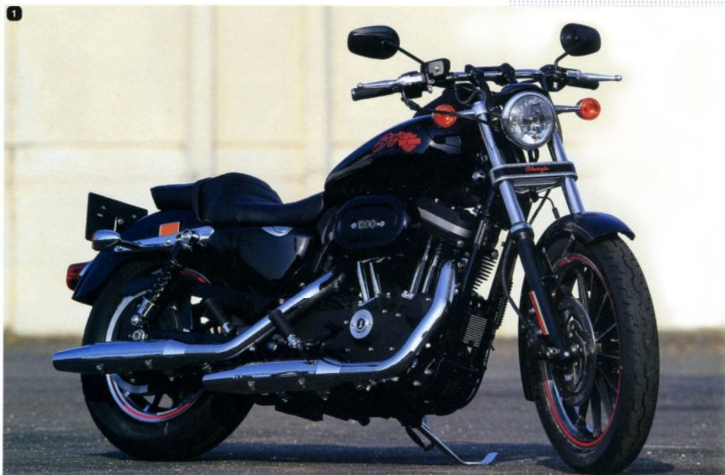
1: 1200の文字が入るエアクリナーは、「スクリーミンイーグルスポーツスターステージ1」。フロントウインカーはオリジナルのような、トリプルツリーにリロケート 2: ライザーは純正フルバックで、ハンドルは「クロームドラッグバー」 3: ホイールは溝入れ加工が施され、スタージス同様オレンジのラインが入っている。フェンダーは純正「フルフロントフェンダープライム」を使用してビンテージな感じに仕上げている 4: 「Sturgis」とバー&シールドのロゴをXL1200用の純正「プライムXLカスタムタンク」で再現した 5: シートはレインボーオリジナルのレプリカシート